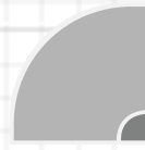
100x100 cm Hoek rond