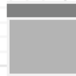
94x100 cm 1,5 Zits