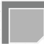
116x116 cm Hoek