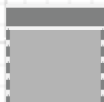
90x105 cm 1,5 zits zonder arm