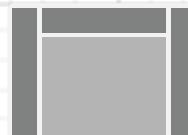
170x105 cm Loveseat