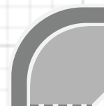
111x111 cm Hoekgedeelte rond