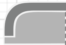
135x105 cm 1,75 zits met 1 arm L/R